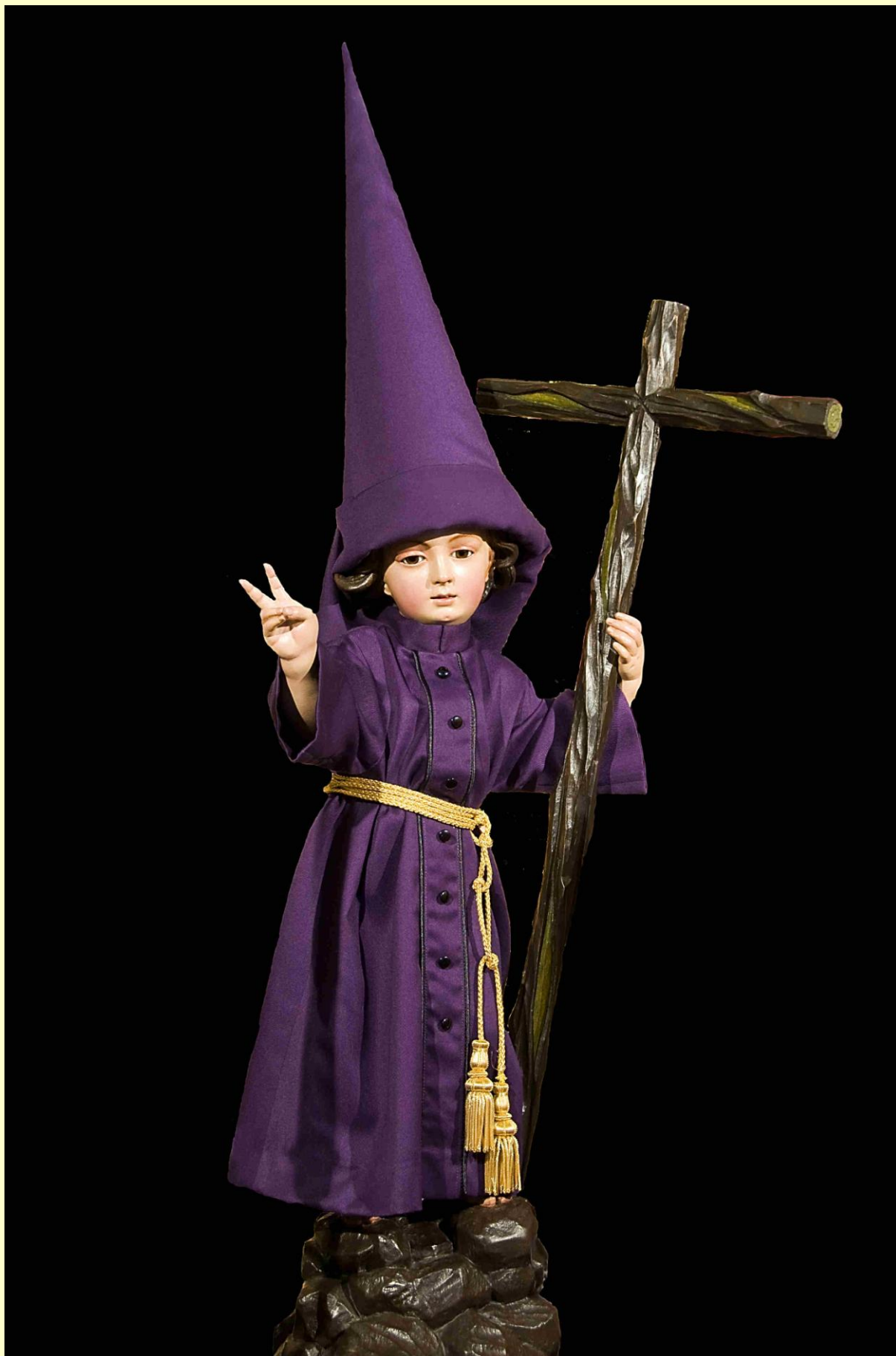
Niño Jesús de la Pasión