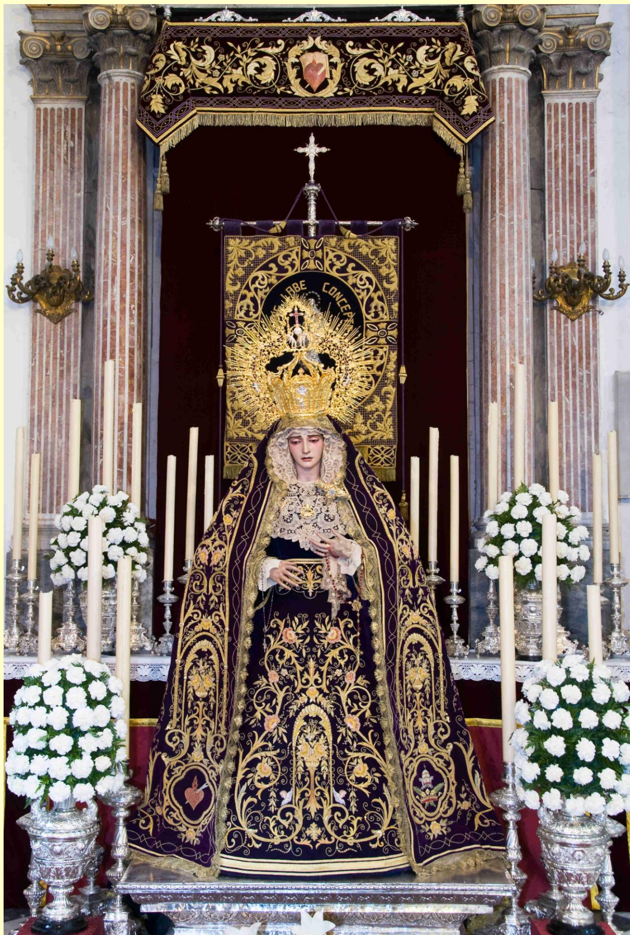
Ntra. Sra. de la Amargura (Cultos de Septiembre)