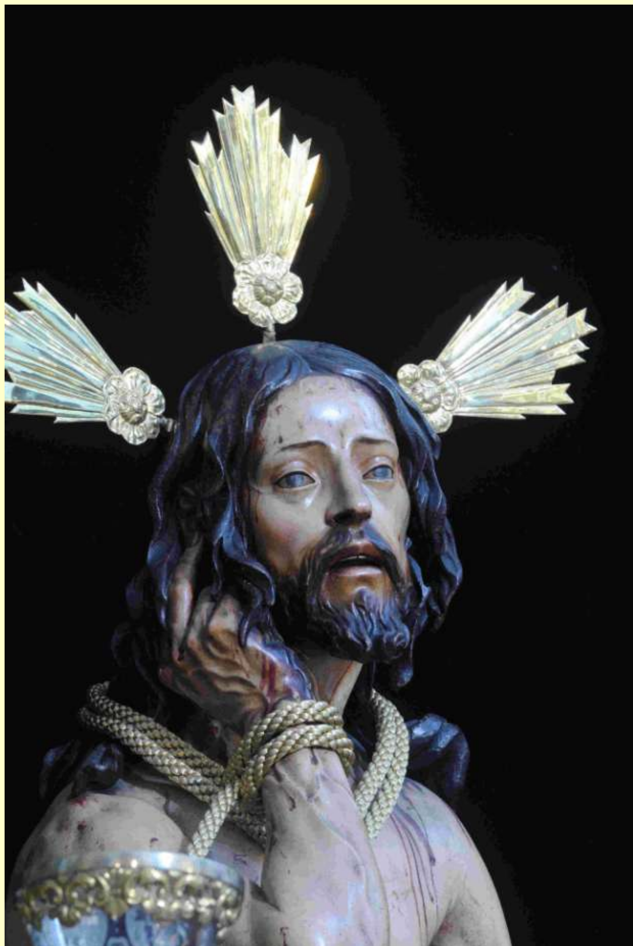
Stmo. Cristo de la Humildad y Paciencia