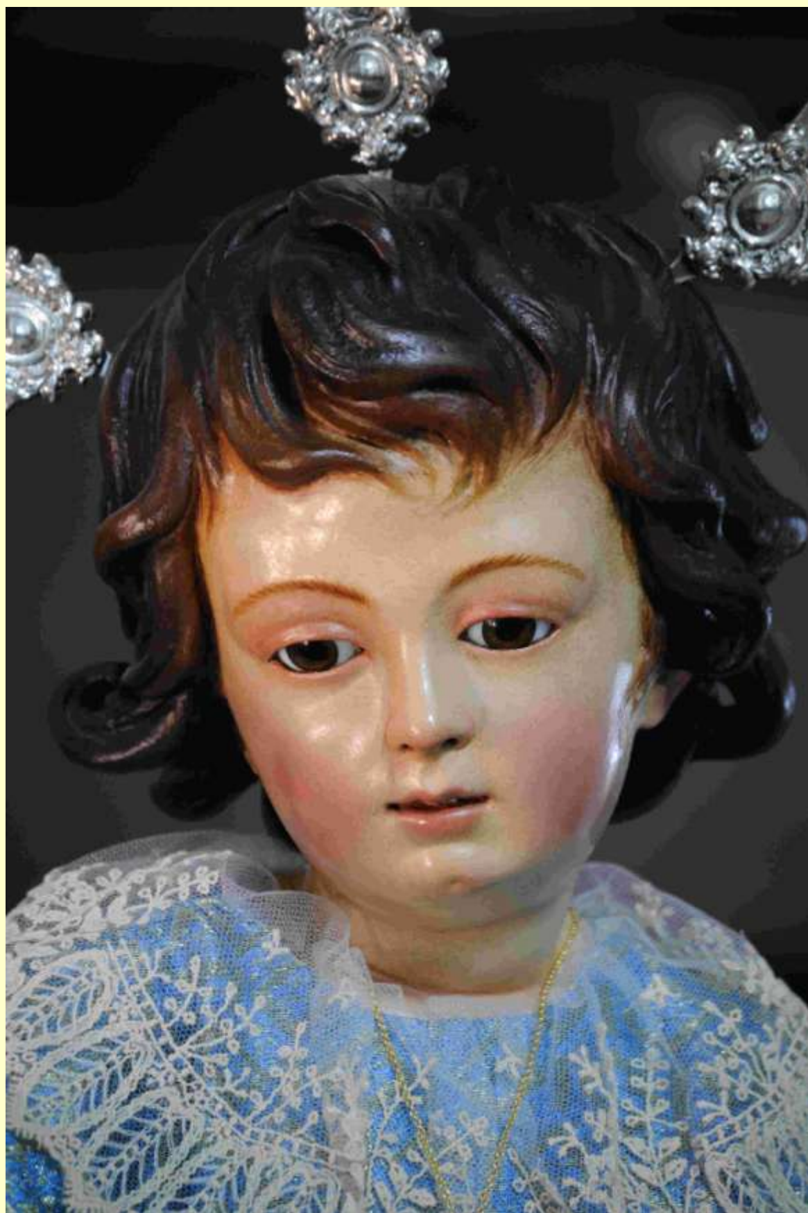
Niño Jesús de la Pasión