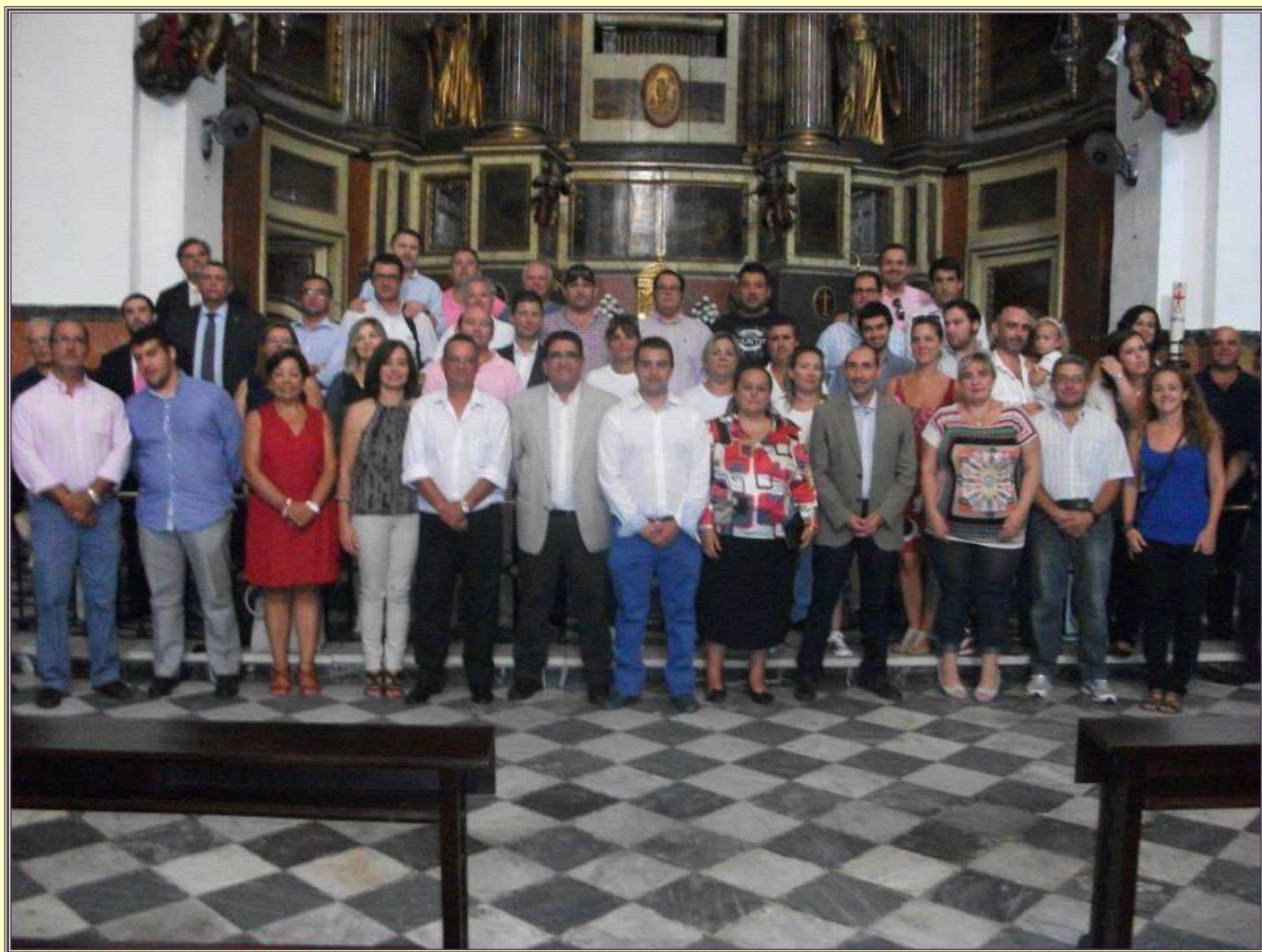
CLAUSURA DE LOS ACTOS DEL “375 AÑOS DE FE”. MISA Y BESAPIES EXTRAORDINARIOS. (8 de Febrero de 2013)